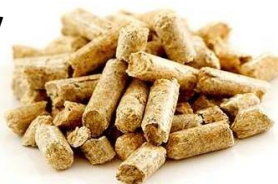
Pre spotřebiče na pelety